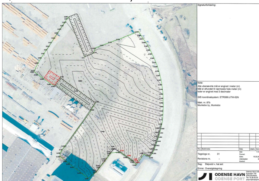
Figur 1: Situationsplan over matr.nr. 87b Munkebo By, Munkebo med støjvolden udvidelse angivet med farven rød.